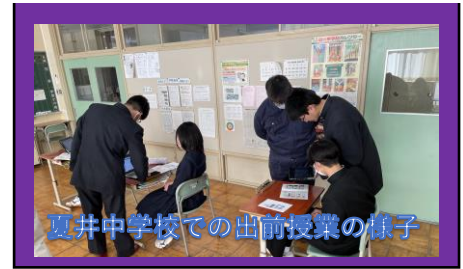
夏井中学校での出前授業の様子